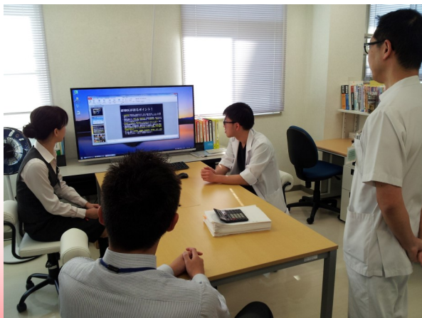
この日のために事前打ち合わせもしっかりやりました

その後のアンケートでも当院のプレゼンが心に残ったという学生さん複数いらっしゃいました！ガイダンス後の懇親会ではその人見つけられなかったけど誰かな？病院見学来てくれたら握手しましょう笑