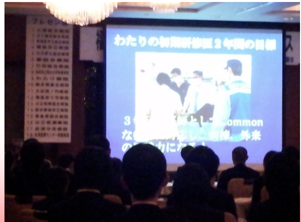
3年目に即戦力として病棟、外来の力になれます！