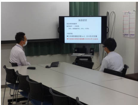
上記にもありますようにインフルで休んでしまったためほとんど写真が撮れずこのような地味な写真しかなく無念