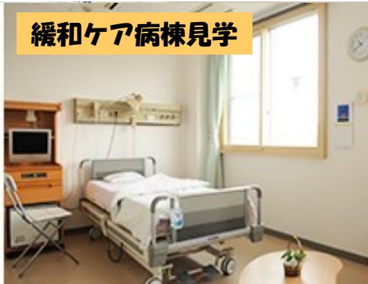
緩和ケア病棟見学