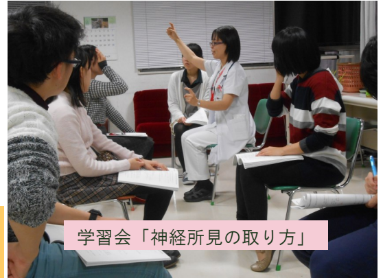
学習会「神経所見の取り方」

こんにちは。 医療生協わたり病院医学生通信です(^-^) いつの間にやら、もう年末ですね。 12月はクリスマスに大晦日とイベントも続き、街もイルミネーションで華やかですね。 冬休みまでもう少し。手洗いうがいはしっかりと!インフルエンザと寒さに負けないように頑張ってください!